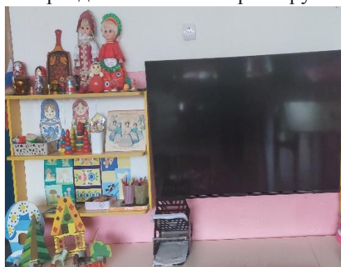
«Ёжик с прищепками»